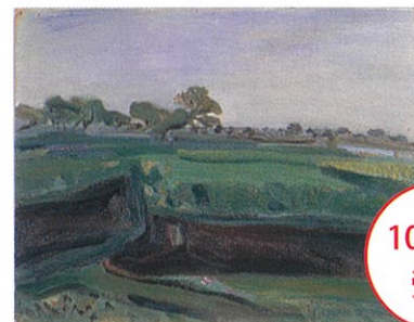
「夏の蒲生野」野口謙蔵

今年、野口謙蔵没後 80 年を迎えます。謙蔵がふるさと蒲生の地でどのように過ごしたのか。謙蔵の絵画に対する姿勢やふるさとへの想い。晩年の野口謙蔵についてお話しします。[定員100人]