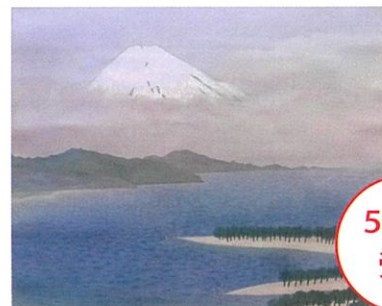
「三保の富士」小野竹喬

実は芸術や文化に関心の高かった近江商人。近代京都画壇の画家たちと、様々な縁がありました。東近江市の近江商人と親交のあった画家たちについてお話しします。講演後は展示室でギャラリートークも実施します。[定員100人]