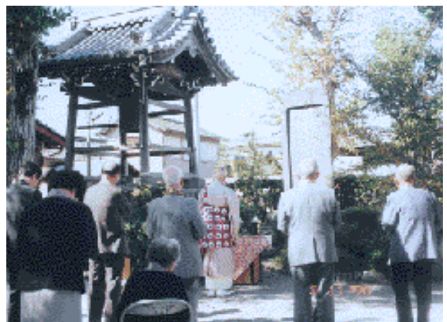
顕彰碑と追弔法要