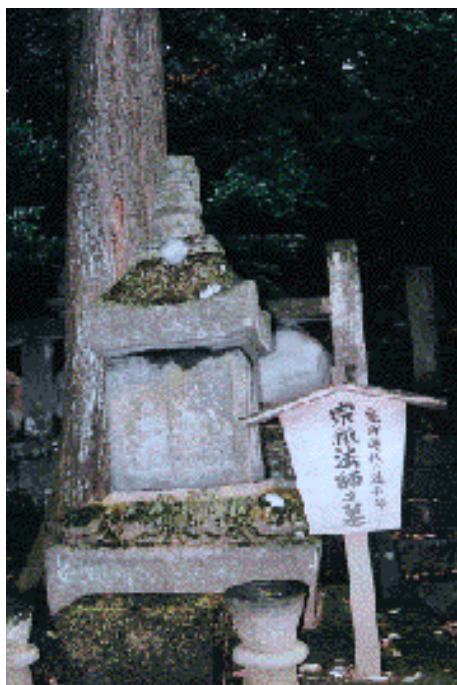
箱根湯本・早雲寺