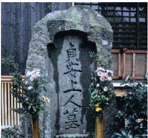
貞安の墓(伊庭・妙金剛寺)