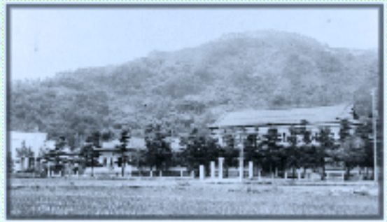
南小旧校舎(大正3年2月18日創立)