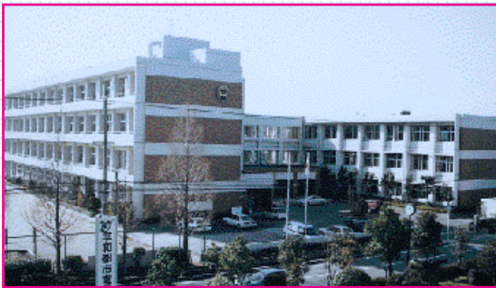
中学校(昭和59年4月18日竣工) 山路30