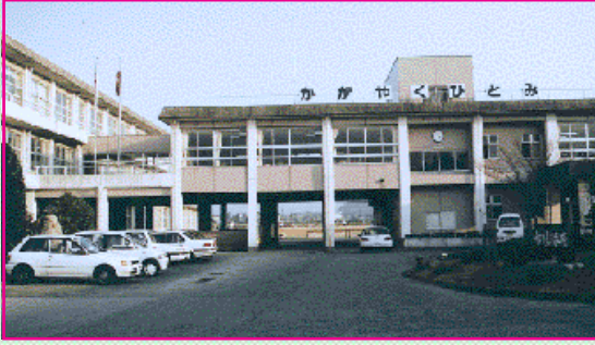
東小学校(昭和54年12月竣工(じゆうこん)) 小川30