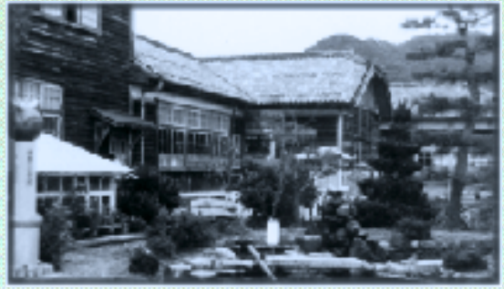
西小旧校舎(昭和2年4月1日創立)