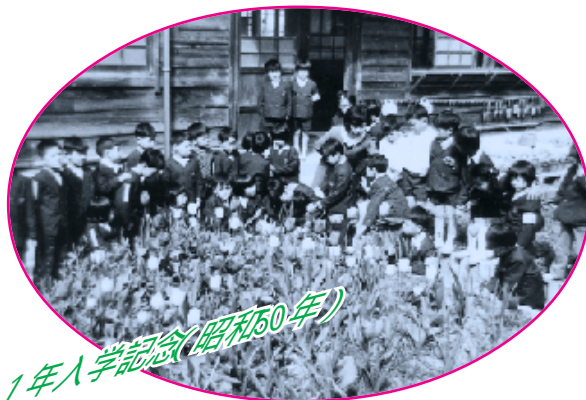
1年入学記念(昭和50年)