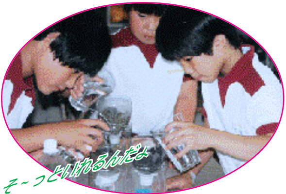
そ〜つといはれるんだよ