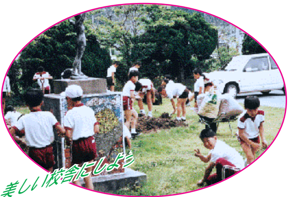
美しい校舎だしよう