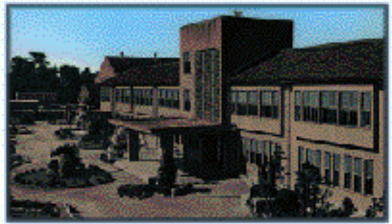
中学校旧校舎(昭和22年4月20日創立)