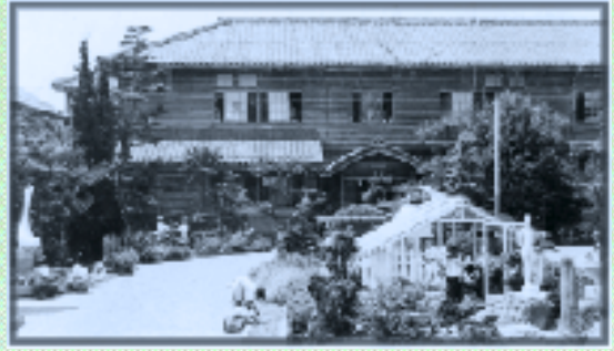
東小旧校舎(明治14年10月23日創立)