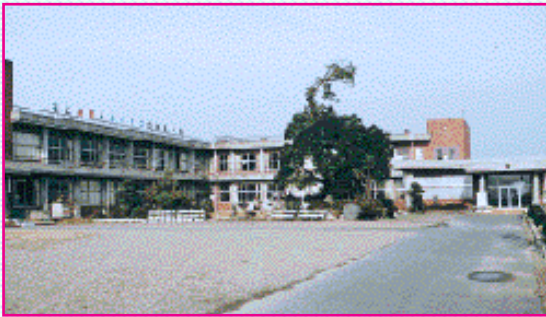
北小学校(昭和57年7月竣工) 福堂2877