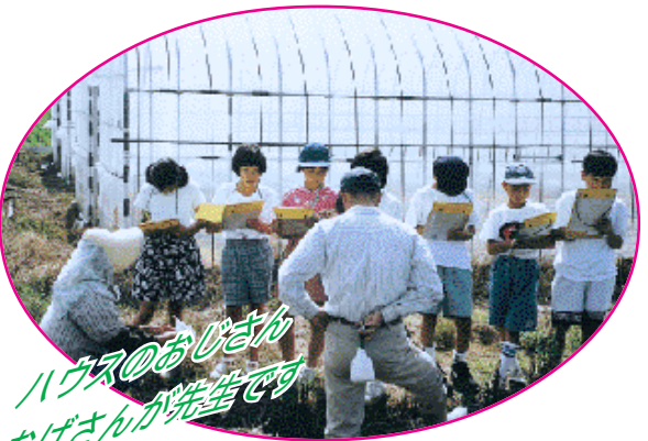
ハウスのおじさん おばさんが先生です