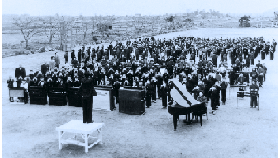
校庭の全校合奏(昭和29年)