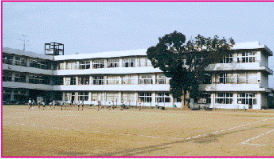
南小学校(昭和57年1月竣工) 猪子12