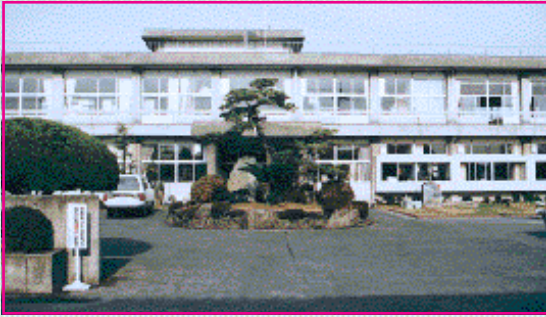
西小学校(昭和51年8月竣工) 伊庭2855