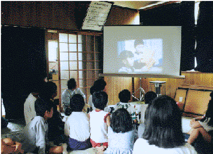
◀スライドによる交通安全指導(桜ヶ丘)