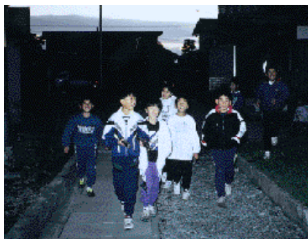
◀火の用～心! マッチ 1 本火事の元

けれども、この“子どもの夜回り”を途絶えさせたくはないものです。なぜなら、“子どもの夜回り”は単なる行事ではなく、子どもたちが大人や社会と接する第一歩なのですから……。