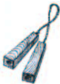
子どもの夜回り・火の用心の『掛け声』移り変わり