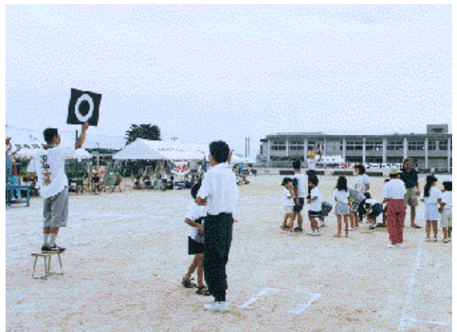
▲交通安全〇×クイズ(躰光寺)