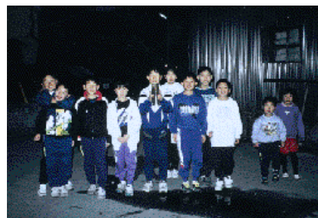
▶みなさん、火事には十分ご注意を!