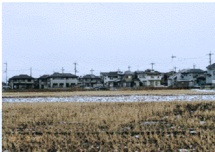
近くの田んぼより大地を望む