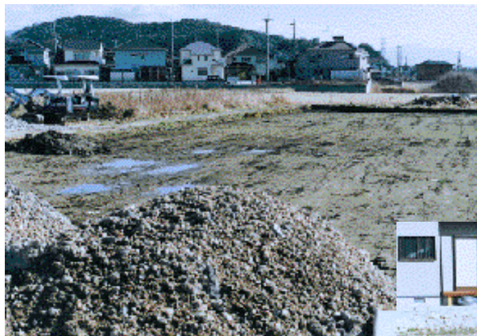
緑が丘造成前の発掘調査