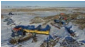
昭和基地全景(約3m×2m) ...空から見た昭和基地の写真