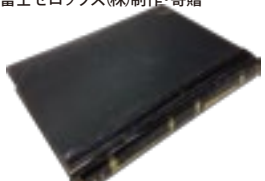
「南極越冬記」のもとになった「西堀個人日誌(複製)」