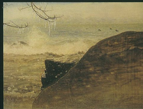
上 左から順に グラマ 1998年 テッサン(色鉛筆) 郷影(近江商人屋敷の通り)部分 2016年 油彩 照破 2012年 油彩《彦根市 荒神山 曾根沼湖岸緑地》 睦ぶ 2012年 油彩《近江八幡湖岸から比良山系を望む》