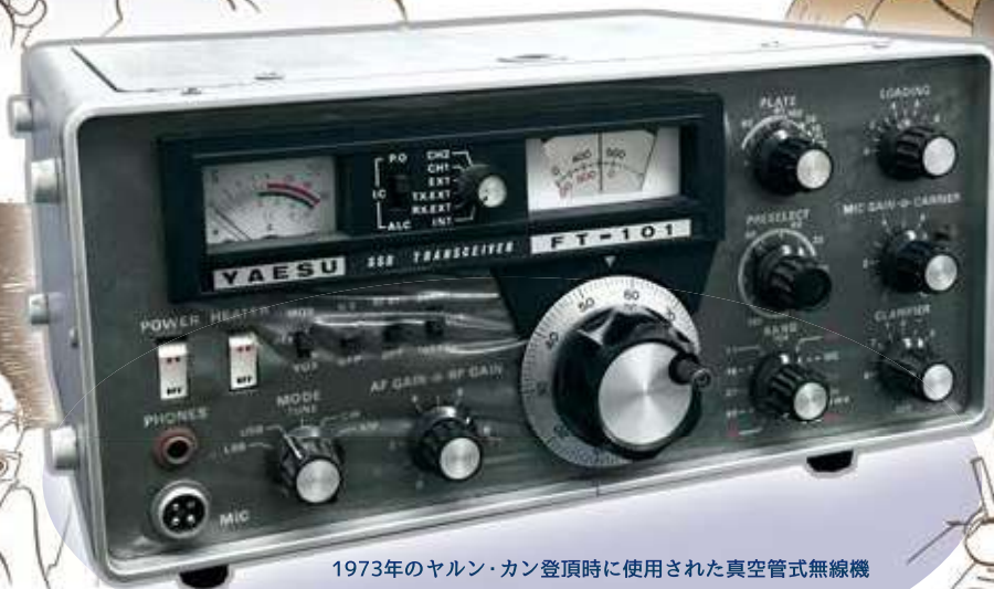
1973年のヤルン・カン登頂時に使用された真空管式無線機