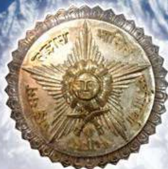
ネパールの叙勲メダル ゴルカ・ダク・シン・バフ勲二等