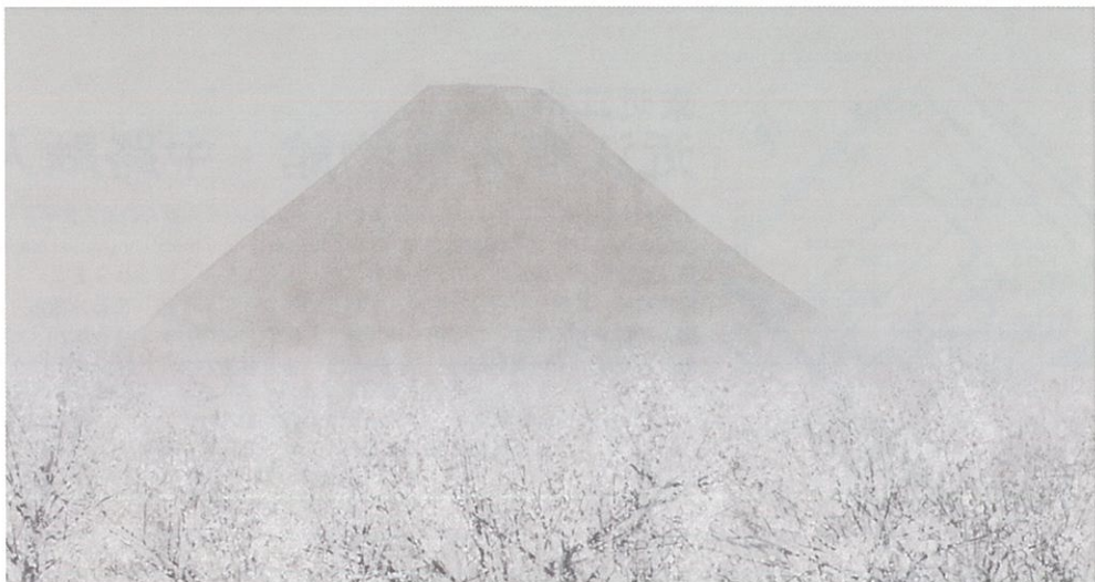
上から「月山」「伊吹山」「浅間山」「梅林富士」

令和3年1月16日〔土〕～3月14日〔日〕 会期中の休館日／毎週月曜日(3月1日は開館) 入館料／大人300(250)円、小中学生150(100)円※(内は20名以上の団体料金)