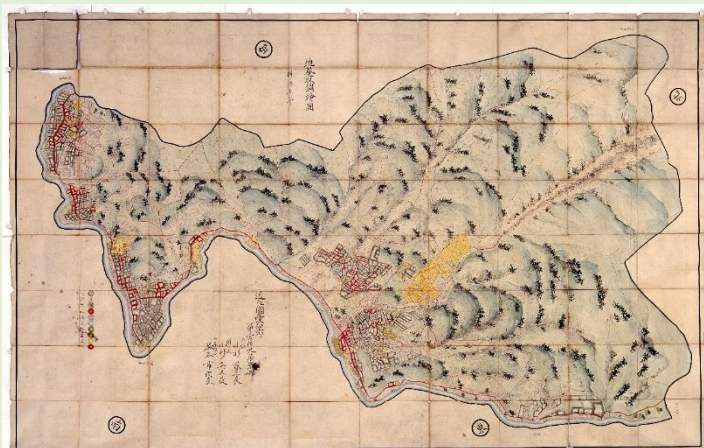
九居瀬村地引全図

絵図には山、道、川、田、畑、屋敷、林、荒地、藪地、原野などが鮮やかな色彩で描き分けられており、明治初期の近代的土地所有権の制度が導入される直前の山村の土地利用が示されている貴重な資料です。